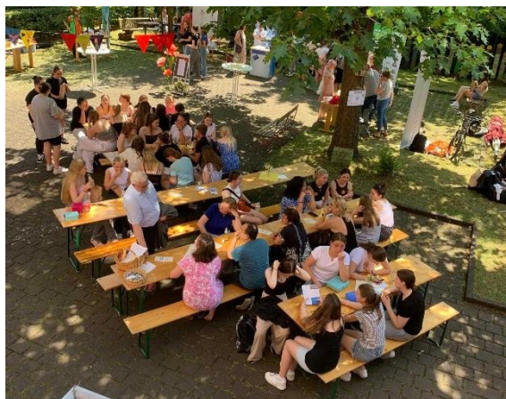
Feier im Hof der Fachschule