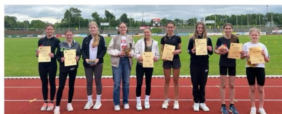
Die Klassensprecherinnen der schnellsten Klassen