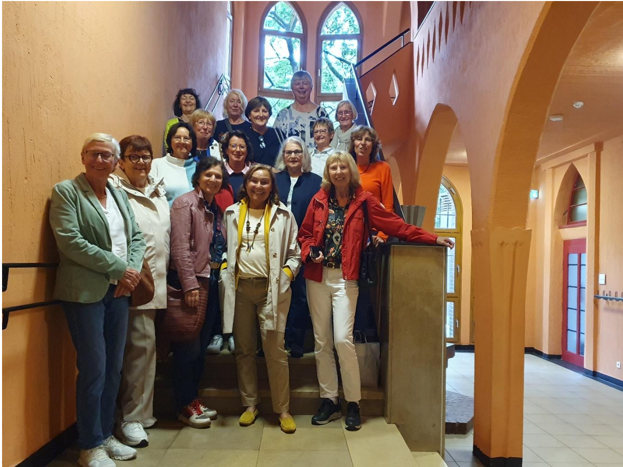
Ehemalige des Abi-Jahrgangs 1970 im Haus Hildegard. Besonderes Interesse galt der expressionistischen Architektur des Gebäudes.

außerhalb des Schulgeländes. Auf den unschuldigen Bürgersteig der Nikolausstraße, von den mächtigen Schulmauern abgeschirmt, glitt ein Rökkchen nach dem anderen, bis sich eine stattliche Kollektion des ungeliebten Gewebes gebildet hatte. Dann geschah das Unvorstellbare, ja geradezu Mirakulöse: Die lockere Ansammlung leicht entzündlichen Stoffes fing plötzlich aus bis heute nicht endgültig geklärter Ursache Feuer. Wasserpistolen gehörten 1970 noch nicht zum Arsenal der Schülerinnenschaft, weshalb Löschversuche dummerweise unterblieben. Rökkchen für Rökkchen verglühte, angefacht von frischem Wind, der ab 68 auch an der Marienschule häufiger zu wehen schien. Schon bald gehörten die Turnrökkchen der Vergangenheit an. Es folgte eine Hosenerlaubnis für den Regelunterricht.