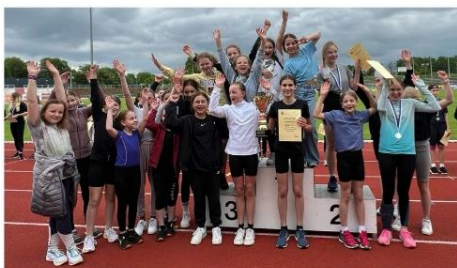
Die sportlichste Klasse