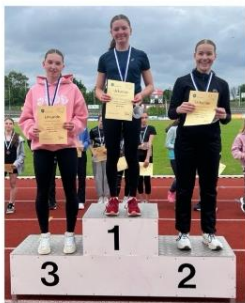
Die Siegerinnen der Bundesjugendspiele 2024

Herzlichen Glückwunsch zur bestandenen Hochschulreifeprüfung und Gottes Segen!