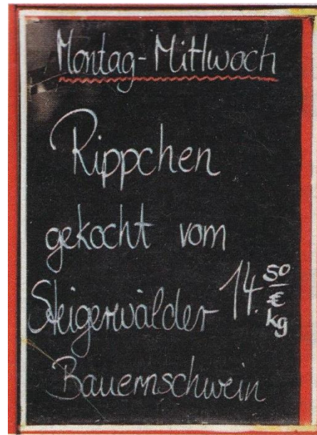
Angebotstafel in einer Metzgerei