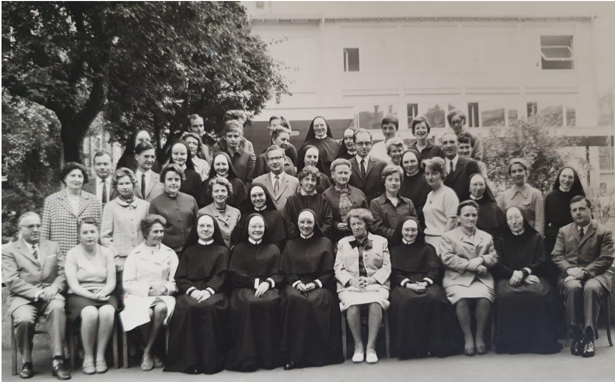
Mitbringsel des Abiturjahrgangs 1970: Foto des Kollegiums der Marienschule Fulda ca. 1969